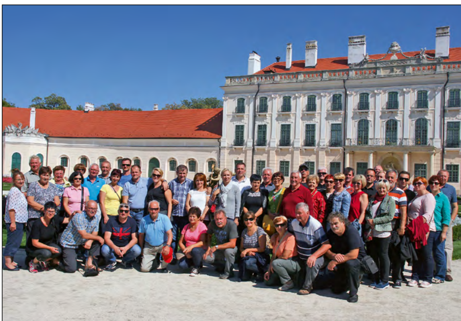
V spomin na skupno druženje ostaja fotografija vseh udeležencev strokovne ekskurzije.