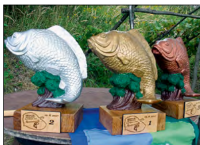
Najboljši na avgustovski ribiški tekmi v Slovenji vasi