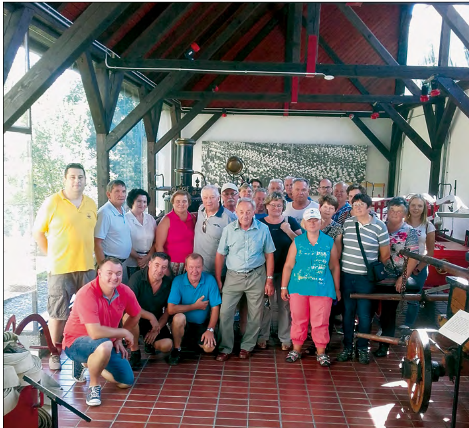
Gasilci Gerečje vasi so se letos odpravili na Dolenjsko.

Konec avgusta je v Gerečji vasi rezerviran za gasilsko ekskurzijo. Letos smo na ekskurzijo šli v soboto, 26. avgusta, in se odpravili na razgibano Dolenjsko, kjer smo si ogledali veliko različnih in zanimivih stvari.