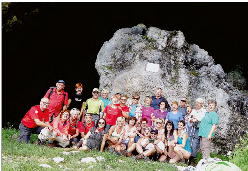
Hajdinski planinci na Olševi, pred Potočko zijalko

Nekdo išče mir vse življenje, a ga ne najde, ker je življenje pretkano z vsemogočimi nitmi in preprekami. Ko vse to prehodiš, poiščeš svoj mir med vršaci, opojnimi cveticami, prečudovitimi pogledi in razgledi okoli sebe in pod seboj. Skale ne govorijo, vedo pa marsikaj, in če bi govorile, bi bilo življenje mnogo lepše, pošteno, skromno, ljubeče in doživeto. Vsaka, še tako skromna cvetlica opeva in govori svojo zgodbo, tako kot jih je opisal naš žal pokojni Slavko Avsenik.