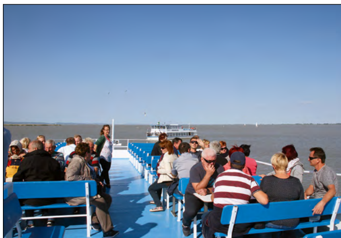
Popotniški utrinki z obiska Gradiščanske, ki je polna lepot in bogate zgodovine.