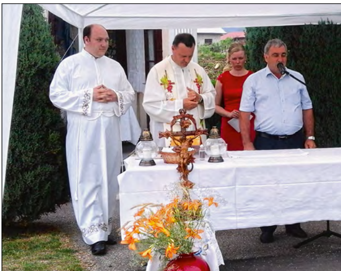
Utrinka z letošnjega Lojzovega žeganja v Gerečji vasi