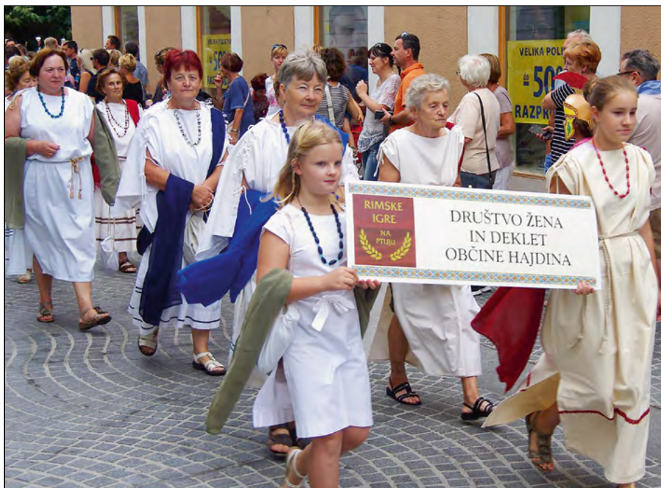
Hajdinske Rimljanke v sprevodu po mestu

Na tradicionalnih X. Rimskih igrah v Rimskem taboru na Štukih so tudi letos sodelovale Rimljanke s Hajdine, članice Društva žena in deklet občine Hajdina, ki so predstavile rimsko kulinariko, s katero vsako leto pogostijo sodelujoče senatorje, legionarje, obrtnike in druge predstavnike rimskega življenja iz davne zgodovine ter marsikoga od obiskovalcev.