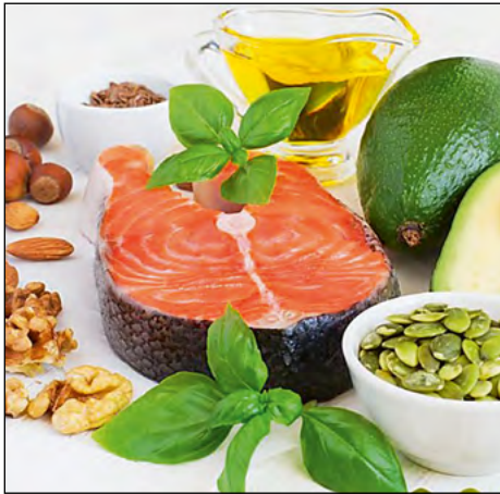
Viri vitamina D

Vitamin D je v maščobi topen vitamin. Je edini vitamin, ki ga telo lahko proizvede tudi samo, s pomočjo obsevanja kože z ultravijolično svetlobo. Že od 10- do 15-minutno izpostavljanje soncu od 2- do 3-krat na teden zadovolji človeške potrebe po vitaminu D. Ljudje, ki veliko časa preživijo v zaprtih prostorih ali živijo na severnih zemljepisnih širinah, kjer je malo sonca, si dovolj vitamina D lahko zagotovijo le z ustrezno prehrano ali z jemanjem vitaminskih dopolnil.