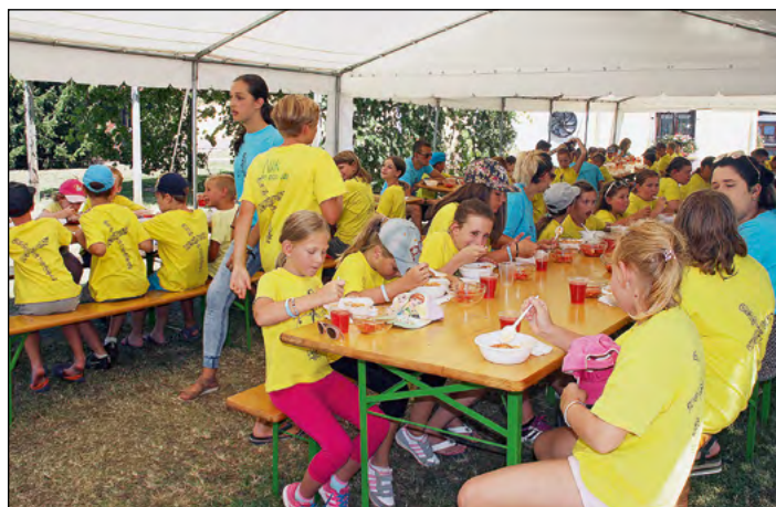
Nova doživetja, novi prijatelji, nepozabni spomini z Oratorija na Hajdini...