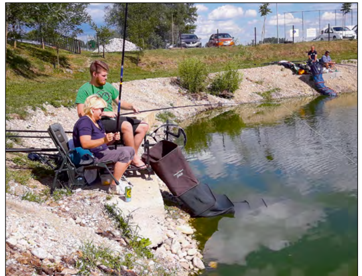
Na ribiški tekmi zanimivih parov ona-on