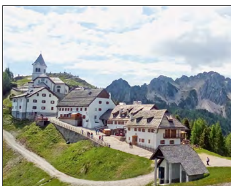
Obiskale so znamenite Svete Višarje in Belopeška jezera.