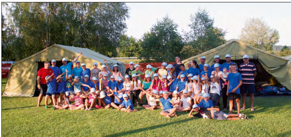
Mladi gasilci iz gasilskih društev občine Hajdina na letošnjem taboru