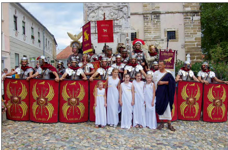
Vestalka v spremstvu legionarjev in senatorja