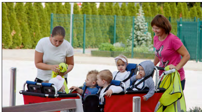
Prvi šolski dan in zanimiv pogled proti vrtcu ...