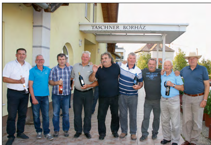
V družbi hajdinskih kletarjev je zmeraj lepo ...