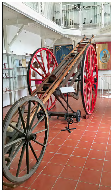
V gasilskem muzeju v Metliki so imeli kaj videti.

zanimivejše dogodke ter s svojim pripovedovanjem potrdila, da ima gasilstvo na Slovenskem močno in dolgo tradicijo. Sledil je individualen ogled muzeja, med katerim smo si lahko ogledali stara oblačila, motorne brizgalne in druge pripomočke, dele zaščitne opreme, značke in priznanja. Po končanem ogledu muzeja smo se odpravili v gasilsko brigado v Novem mestu, kjer so nam na kratko predstavili svoje delovanje, temu pa je sledil ogled vozil. Okrog enih smo se odpravili na kosilo, kjer smo dobro jedli in pili ter se pripravljali na še zadnji del ekskurzije. Po kavi smo se