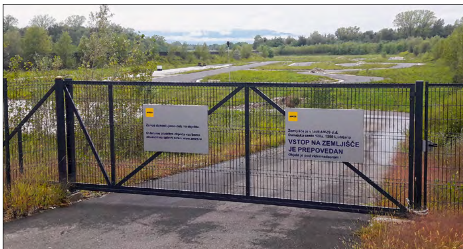
Kartodrom v Slovenji vasi bo do prihodnjega leta sameval.

Iz družbe Avto-moto zveza Slovenije (AMZS), ki je od lani lastnica kartodroma v Slovenji vasi v občini Hajdina, so sporočili, da kartodrom letos še ne bo začel delovati. Pri zagotavljanju ustrezne infrastrukture, potrebne za nemoteno in varno delovanje, je prišlo do nekaterih nepredvidenih zastojev. Okoliški domačini si bodo torej za zdaj lahko oddahnili, a načrti AMSZ se na tej lokaciji naj ne bi spreminjali, zagotavlja lastnik.