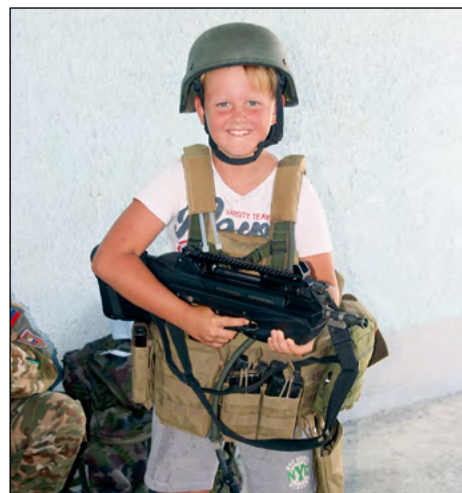
Taborniški utrinki iz Slovenje vasi