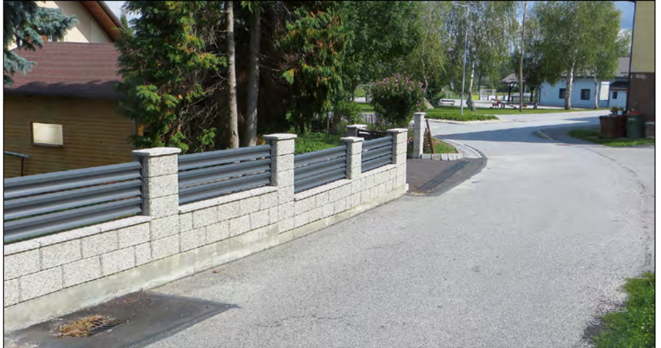
V Slovenji vasi je bilo urejeno odvodnjavanje s pomočjo linijskega požiralnika.