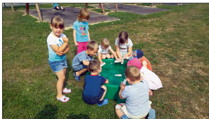
Poletni utrinki iz vrta