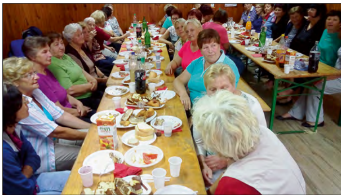
Vesela družba na Aninem pikniku