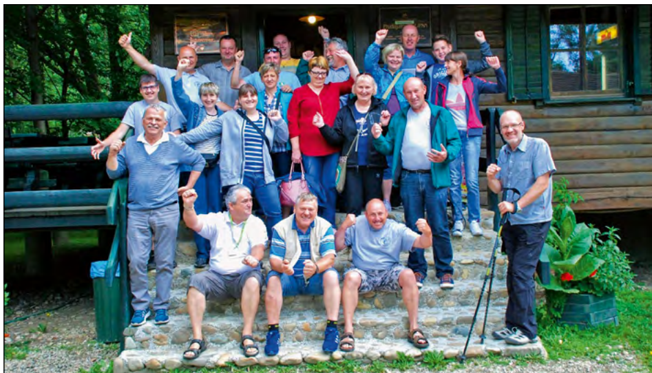
Ribiči na Otoku ljubezni v Ižakovcih

Člani RD Žejne ribice poleg tekmovalj in druženj ob ribniku pripravimo za svoje člane vsakih nekaj let potepanje po Sloveniji. Letos smo se odpravili v Prekmurje, kjer smo si ogledali znamenitosti, pokušali prekmurske dobrote in si ob koncu dneva v domači gostilni privoščili tradicionalno večerjo.