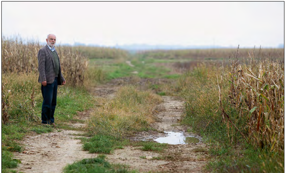
Na razpisu za agromelioracije na komasacijskem območju je Občina Hajdina pridobila sredstva v višini 864.648,72 EUR.

stekli so postopki za odkup potrebnega zemljišča. Vsa problematika je bila Direkciji RS za infrastrukturo podana tudi v pisni obliki. Skladno z zaključki delovnega sestanka se pričakuje predstavitev odgovorov še septembra 2017.