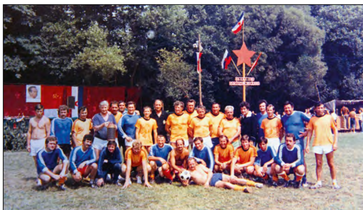
Ekipa iz leta 1981. Marsikoga žal ni več med nami.

Športno društvo Hajdina, ki je leta 2016 praznovalo sedemdesetletnico svojega obstoja, je ob tem jubileju izdalo zbornik o sedmih desetletjih igranja nogometa na Hajdini. Med mnogimi objavljenimi fotografijami je zanimiv posnetek iz leta 1981, ko so se ob 35-letnici prvič zbrali nogometni veterani Spodnje in Zgornje Hajdine ter se pomerili med seboj. Kakšen je bil takrat rezultat, ne vemo, vemo pa, da je v prazničnem letu zmagala Spodnja Hajdina.