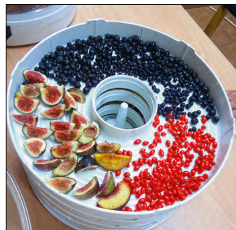
V Dražencih se članice tamkajšnjega društva gospodinj letos posvečajo sušenju sadja in zelenjave.