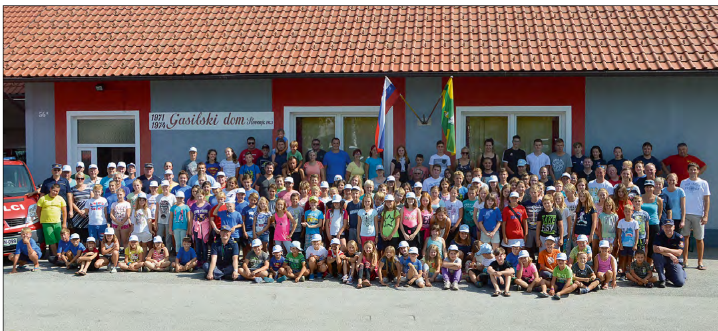
Skupinska fotografija vseh udeležencev na trinajstem taboru gasilske mladine OGZ Ptuj