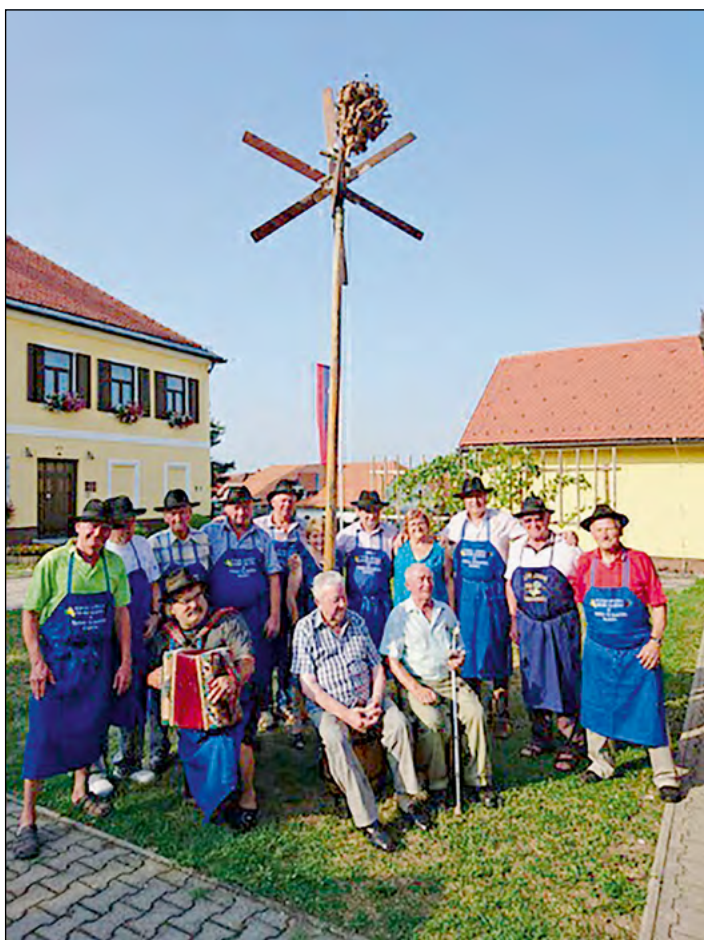
Skupna fotografija pod hajdinskim klopotcem

V poznem poletnem času v naših vinogradih, ob brajdah in vinskih kleteh že veselo pojejo klopotci. Vinogradniki jih postavijo okrog lovrenčevega in na velike maše. Postavitev klopotca je že od nekdanjega praznika in tako je ponekod še danes, to lepo tradicijo pa ohranjajo tudi hajdinski kletarji. Klopotec so pri hramu, Martinovi kleti in potomki trte z Lenta postavili 9. avgusta.