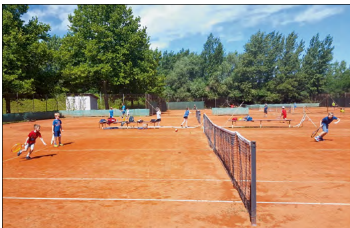
Pestro dogajanje na igrišču

Otroci so se učili osnovnih teniških vrlin in se pri tem tudi zabavali. Na zaključku niso manjkale pice pa tudi majice kot spomin na dogodek. Sicer pa Tenis klub Skorba vabi vse mlade nadobudneže, da se priključijo njihovim aktivnostim, ki so povezane tudi s šolo tenisa za mlade.