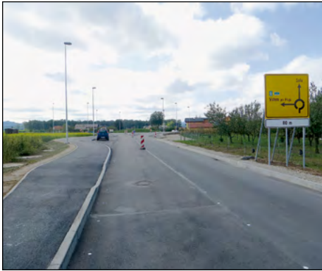
V Dražencih bo kmalu končana izgradnja krožišča s povezovalno cesto na nov avtocestni odsek.

Občina Hajdina je prejela odločbe o uspešni prijavi na 1. javni razpis Ministrstva za kmetijstvo, gozdarstvo in prehrano za podukrep 4.3 Podpora za naložbe v infrastrukturo, povezano z razvojem, posodabljanjem ali prilagoditvijo kmetijstva in gozdarstva. Predmet razpisa je operacija Izvedba agromelioracij na komasacijskih območjih.