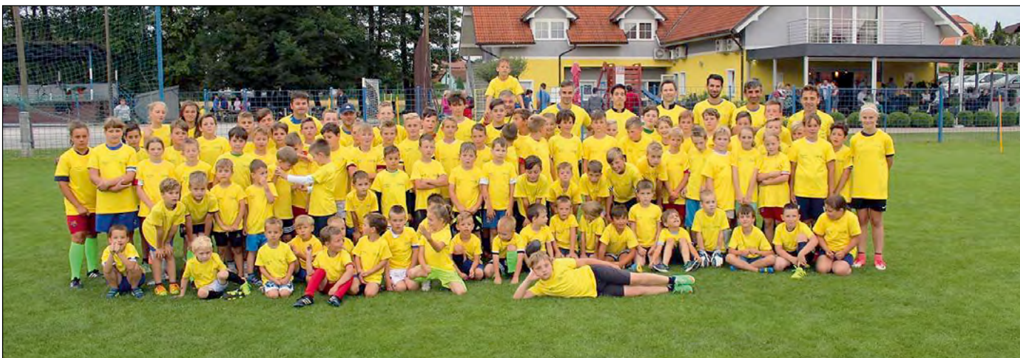
Skupinska slika udeležencev 17. Poletne šole nogometa 2017