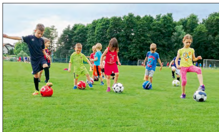
Najmlajši v Poletni šoli nogometa 2017

Športna zveza občine Hajdina in Otroška nogometna šola Golgeter Hajdina sta v prvem tednu poletnih počitnic že tradicionalno organizirali športne aktivnosti za otroke, stare od 5 do 15 let. Tako je bila od 26. do 30. junija v Športnem parku ŠD Hajdina organizirana že 17. Poletna šola nogometa, ki v občini Hajdina predstavlja vsakoletni zaključek tekmovalne sezone mladih nogometašev.