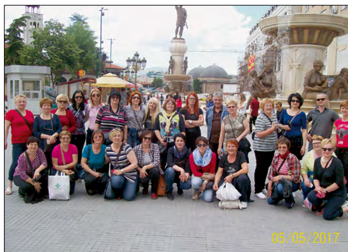
Utrinki s potepanja po Makedoniji ...