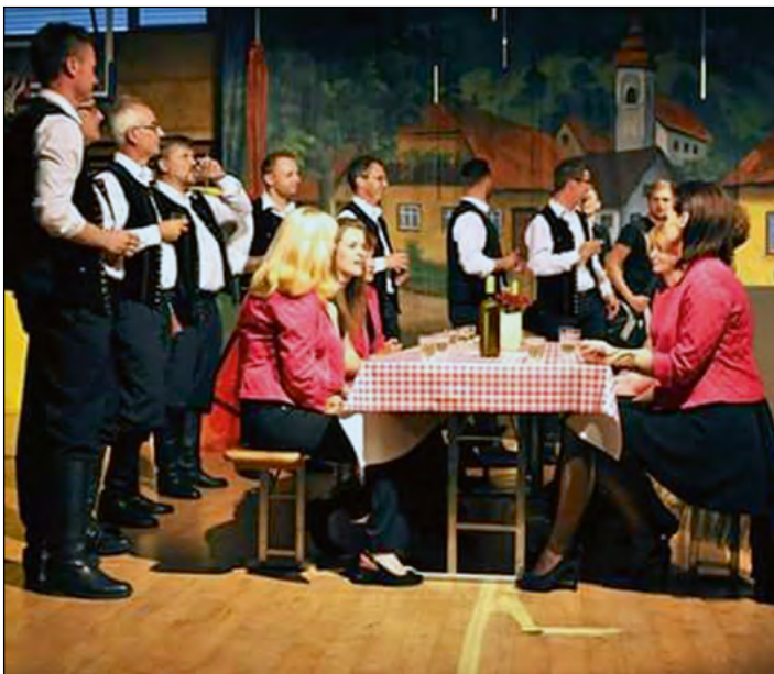
Utrinek z nastopa v Markovcih

Učiteljsko-vzgojiteljski pevski zbor OŠ Hajdina