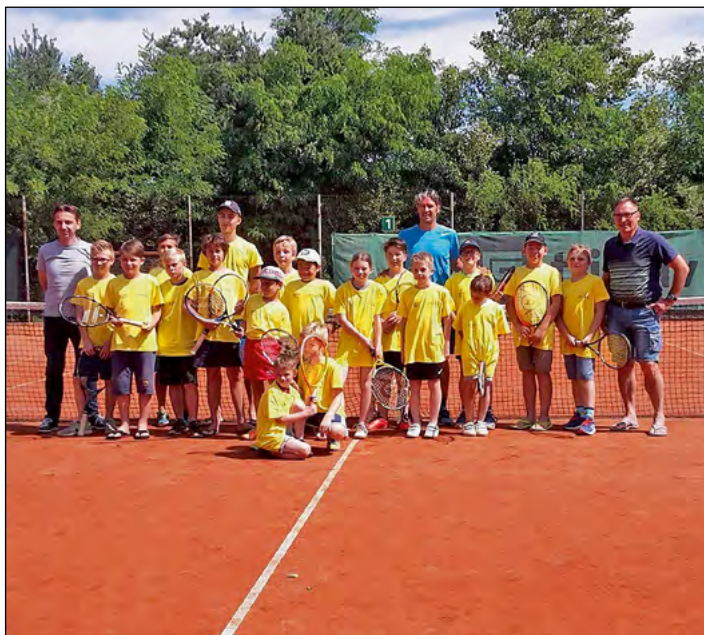
Skupinska slika udeležencev 17. Poletne šole tenisa 2017