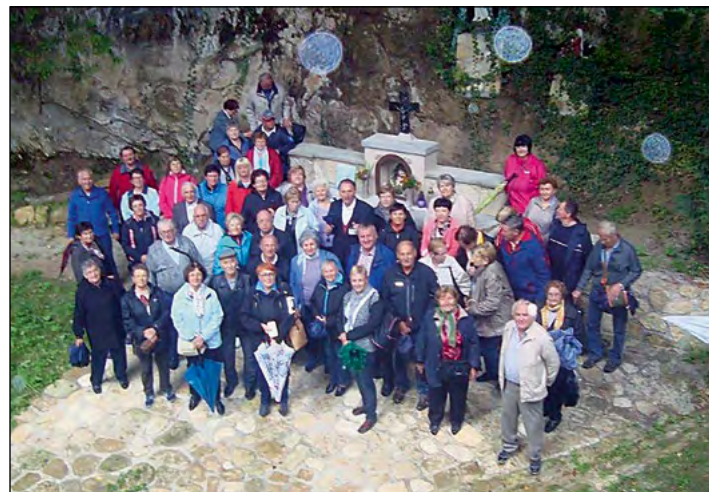
Tudi dežne kaplje niso bile ovira za ogled vseh načrtovanih znamenitosti.